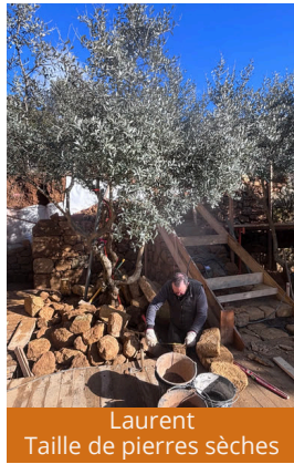
Laurent Taille de pierres sèches

Un besoin spécifique ? Si votre demande n'est pas dans la liste, parlons-en ! Nous cherchons toujours une solution ou nous vous orientons vers les professionnels locaux adaptés.