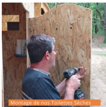
Montage de nos Toilettes Sèches