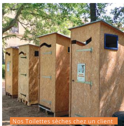
Nos Toilettes sèches chez un client