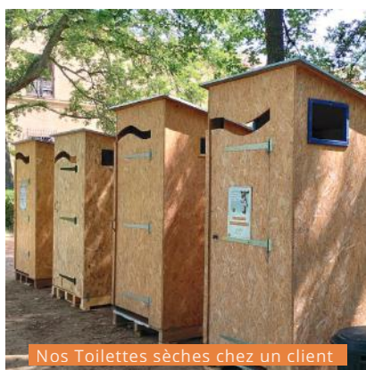
Nos Toilettes sèches chez un client